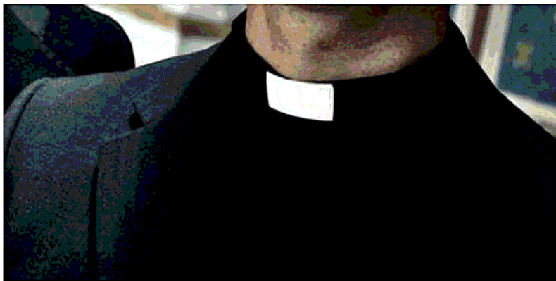
Tre reati ipotizzati L'inchiesta è stata chiusa con le accuse di minacce, violenza sessuale e droga

Le ultime notizie, in ordine cronologico, riferivano di una sua parziale irreperibilità. Parzialità derivante dal fatto che la Curia veronese sarebbe stata a conoscenza del luogo in cui si trovava. Ora la situazione sembra essere cambiata al punto che anche la Curia veronese non sarebbe in grado di dire dove si trovi. Un aspetto della vicenda ancora più importante se ne viene considerato un altro: la procura di Brescia ha terminato le indagini nei